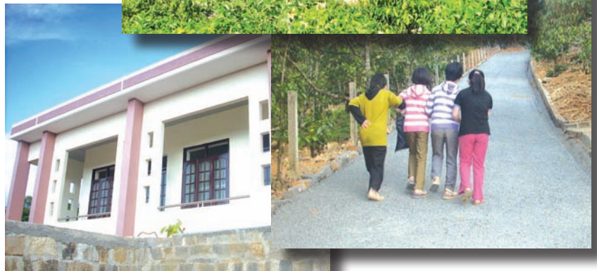
The new Suoi Mo Home in Bao Loc and a few of the residents.