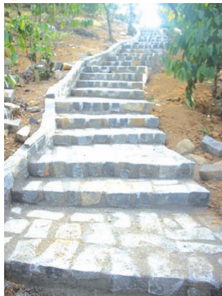
New stonework steps under construction...and completed...at the new Suoi Mo Home in Bao Loc.